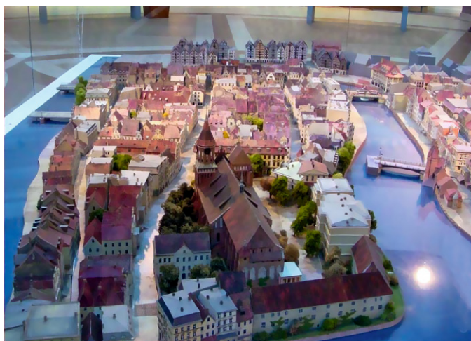
Makieta przedstawiająca wygląd wyspy w okresie przedwojennym